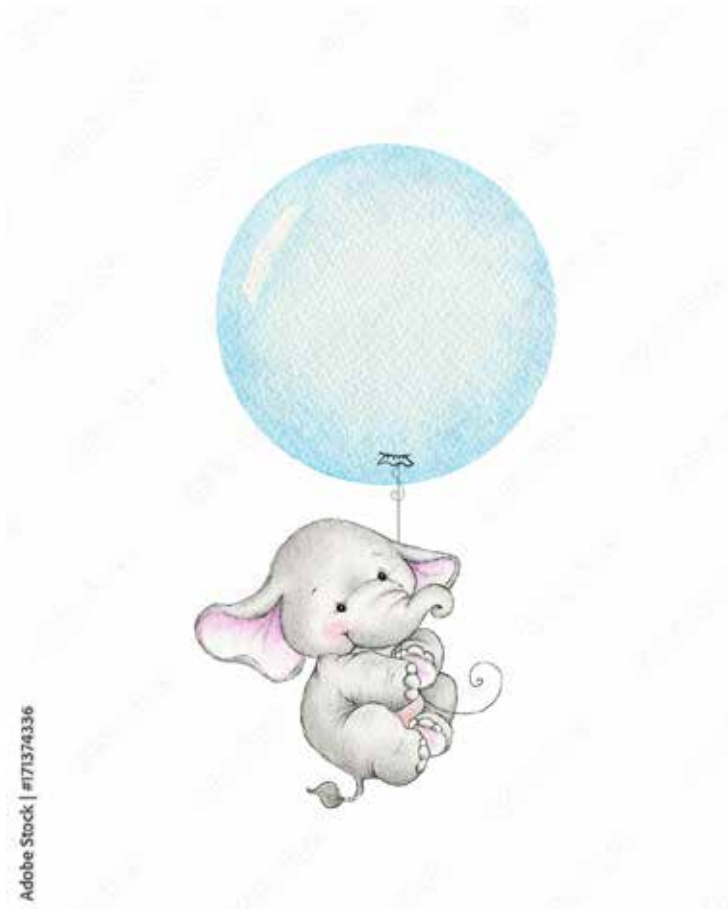
Motiv Geburten 09