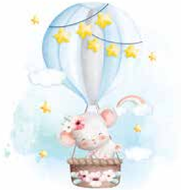
Motiv Geburten 07