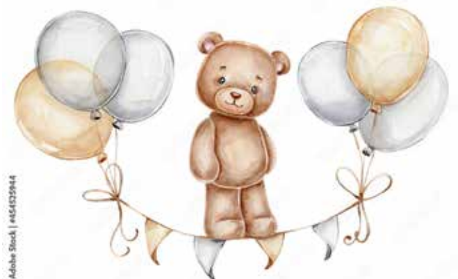
Motiv Geburten 11