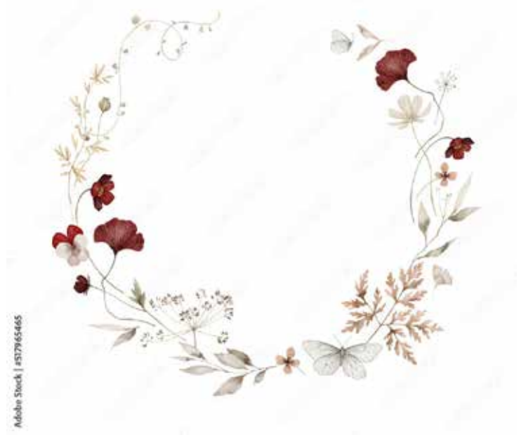
Motiv Geburtstag 17