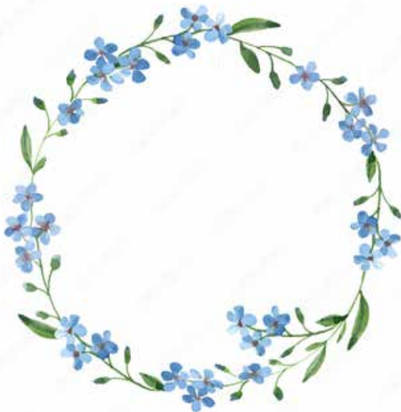
Motiv Geburtstag 14