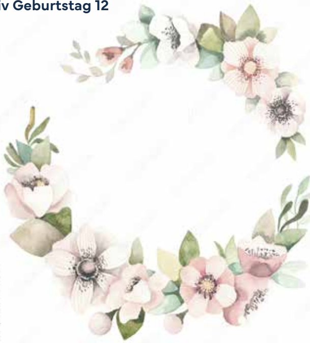
Motiv Geburtstag 12