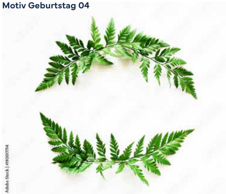
Motiv Geburtstag 04