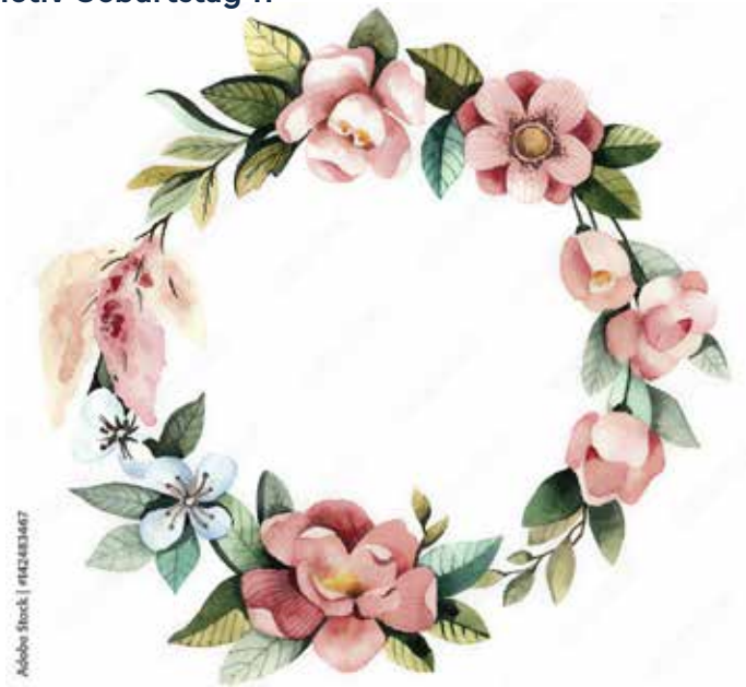
Motiv Geburtstag 11