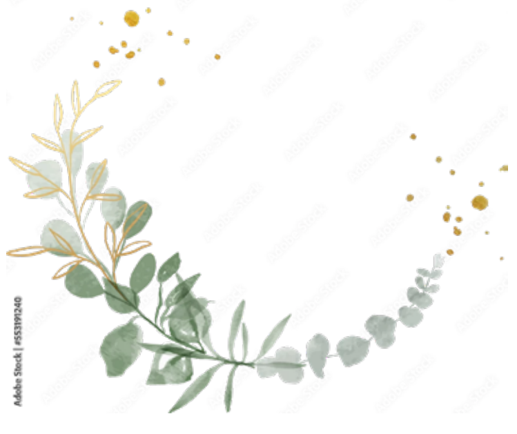
Motiv Geburtstag 19