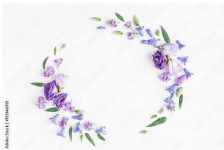
Motiv Geburtstag 06