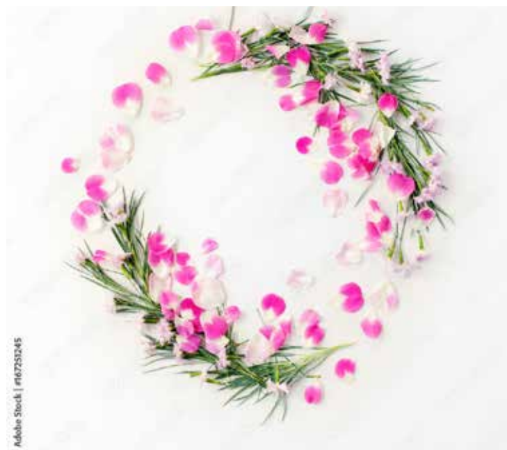
Motiv Geburtstag 07